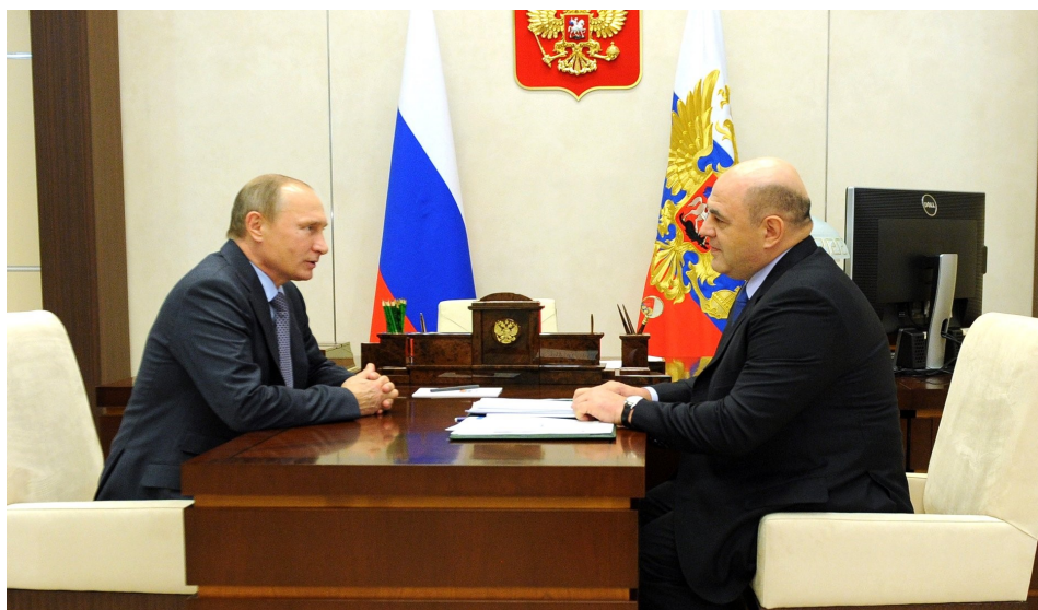
Президент России В.Путин и руководитель ФНС России М.Мишустин. 20 ноября 2015г.